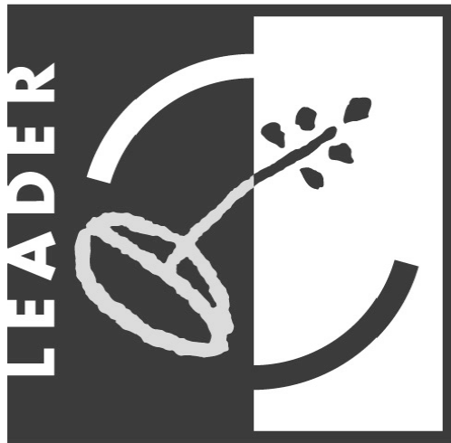
Лого на Leader.

http://ec.europa.eu/europeaid/work/visibility/index_en.htm .